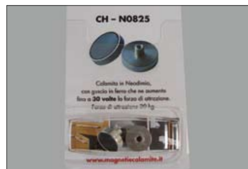
SINGLE PACK: imballo tipo GDO fai da te.