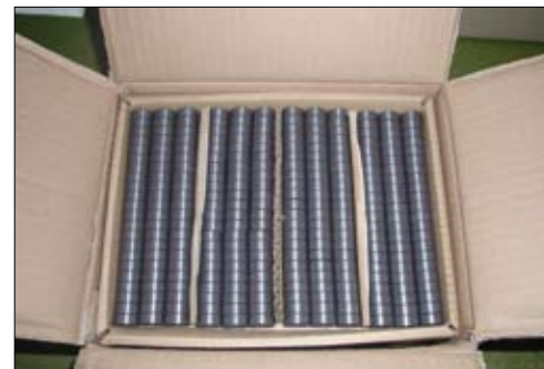
BULK SFUSO: in cartoni.