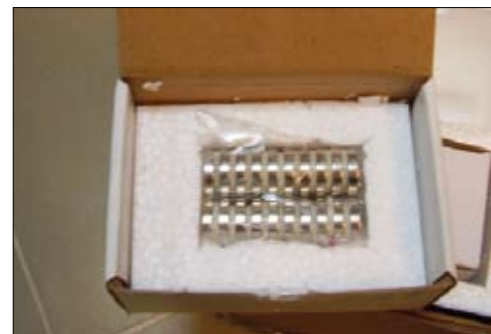
UNIT BOX: scatoline e poi imballo tipi Alveare.